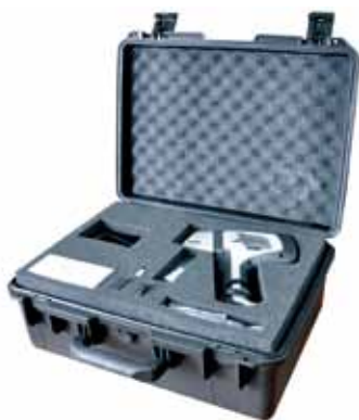
原厂标准手提防震箱