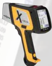
DELTA Premium DP2000

坚固耐用的XRF光谱合金分析仪DELTA系列包含多种可精确有效地满足材料分析要求的高产工具。用户可以根据自己的分析需要，方便地选择最适宜的DELTA手持式XRF光谱合金分析仪，如：分析灵敏度得到优化且适用于轻质元素分析的DELTA Premium和DELTA Professional分析仪，或价格虽便宜却能满足许多应用的DELTA Classic plus分析仪。