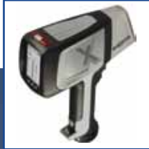
DELTA Classic plus DCC2000