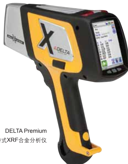
DELTA Premium 手持式XRF合金分析仪

DELTA在数秒钟之内即可提供便于解读的结果屏幕，这个屏幕中的列表或光谱格式可以自行定义。可通过USB、蓝牙技术将数据方便、快速地导出到Microsoft Excel的电子数据表，或通过无线打印机直接将数据打印出来。