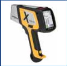
DELTA Premium DP2000