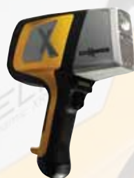
DELTA Professional DPO2000

贵金属模式：可多检测Ir, Pt, Au, Rh, Ge, Ga, Ru, In, Os 9种元素，总计可测试37种元素含量(选配模式)。