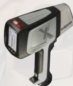
DELTA Classic Plus DCC2000

贵金属模式：可多检测Ir, Pt, Au, Rh, Ge, Ga, Ru, In, Os 9种元素，总计可测试37种元素含量(选配模式)。