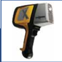
DELTA Professional DPO2000