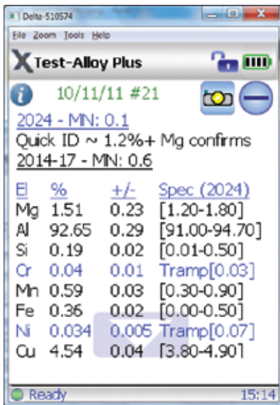
DELTA的合金检测结果屏幕