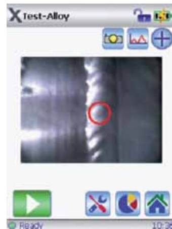
用于对焊接材料之间的焊道进行分析的3毫米微点瞄准