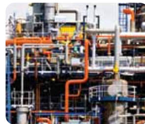
石油化工/电力工业

在您需要一个性能可靠的分析工具对材料的成份进行快速精确的辨别时，请使用我们的DELTA分析仪。无论何时何地，DELTA都会对各种工件进行较以往更快更精确的检测。这些部件包含削屑、刨花、棒、线、细小的工件和部件，以及更大的材料或结构。