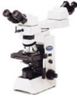
三目观察筒/U-CTR30-2 与中间附件/ U-TRU