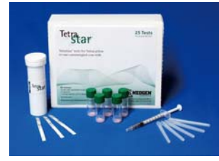
四环素类快速检测 试纸条

针对乳制品行业标准中抗生素残留及非法添加剂检测的严格要求，Neogen公司提供了一系列高效精准且简单快捷的快速检测试纸条，和满足不同客户需求的解决方案。