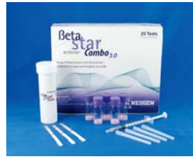
\beta -内酰胺类&四环素 类快速检测试纸条