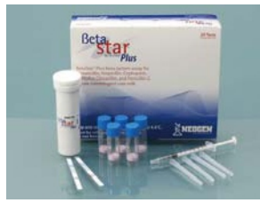
\beta -内酰胺类&头孢噻 吩快速检测试纸条