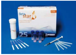
内酰胺类快速 检测试纸条