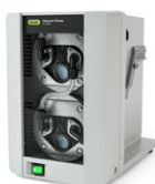
Vacuum Pump V-300 经济、无噪音的真 空源