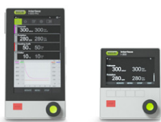
Interface I-300 / I-300 Pro 集中触摸屏控制、 记录和图表显示