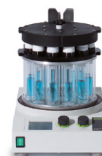
Multivapor™ P-6 / P-12 高效的多样品蒸发仪