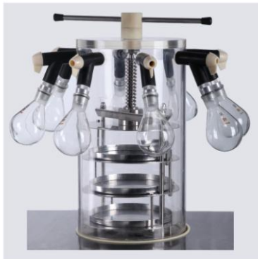
多歧管压盖型干燥桶