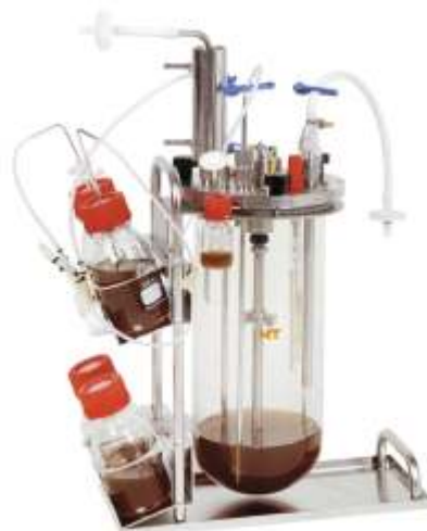
简单安全的一体化离位灭菌