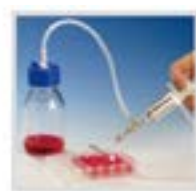
液体回收(带多头分配器)