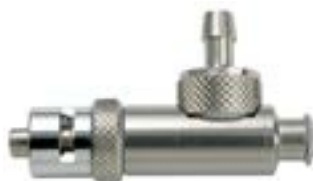
废液吸取套件 (请选用强化密封套件)