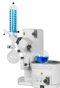
Rotavapor® R-210 性能卓越的蒸发性能