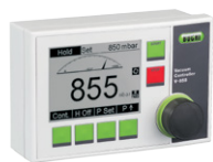
Vacuum Controller V-850 / V-855 实现最佳的过程性能