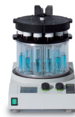
Multivapor P-6 / P-12 高效的多样品蒸发仪