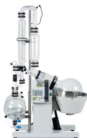
Rotavapor® R-220 SE 扩展实验室的最佳选择