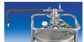
带填充法兰口的液氮储存罐