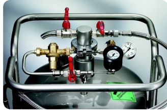
压力控制套件（可选）