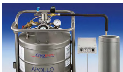
在冷阱上使用液氮液位控制器