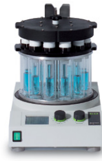
Multivapor P-6 / P-12 高效的多样品蒸发仪