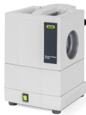
Vacuum Pump V-700 经济实用的真空源