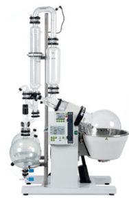
Rotavapor® R-220 SE 扩展实验室的最佳选择