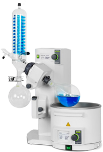
Rotavapor® R-215 性能优异的蒸发性能