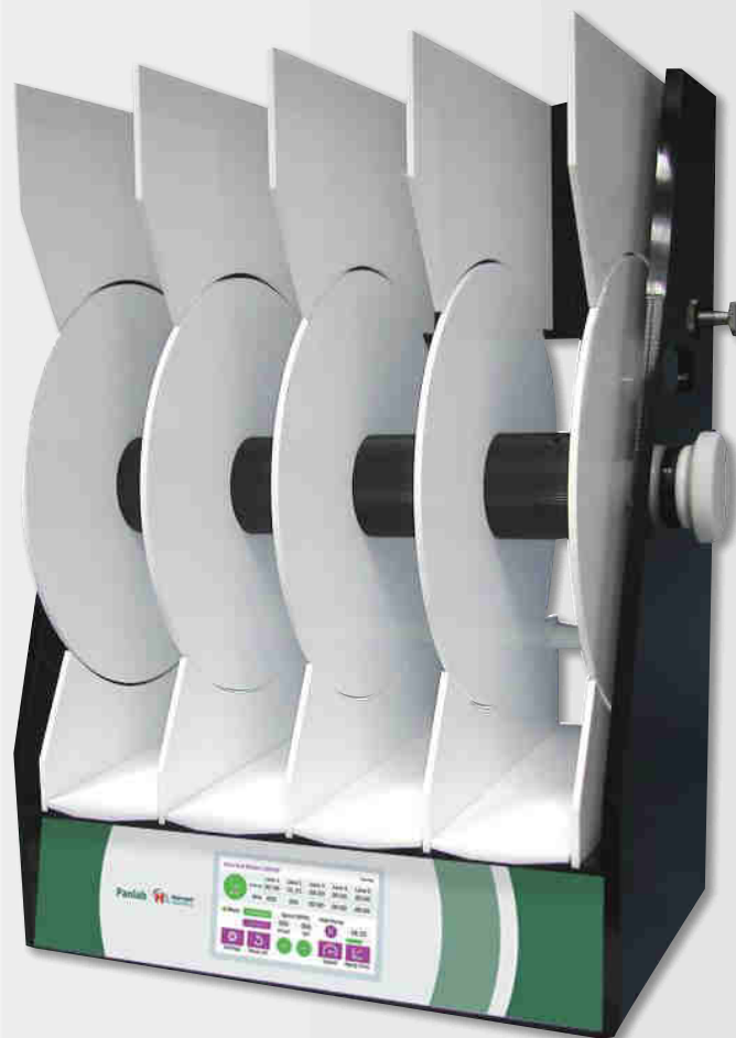
全新LE 8305 型转棒仪