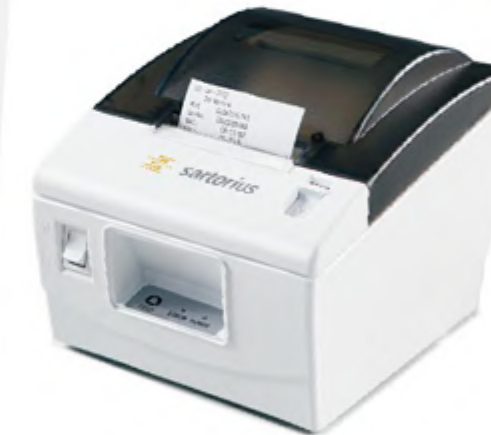
Plug Et Play

大号的水平调节轮以及便于观测的水平指示气泡，使您可以轻而易举地完成 Practum 天平的水平调整，确保称重结果具备出众的重复性和精确性。