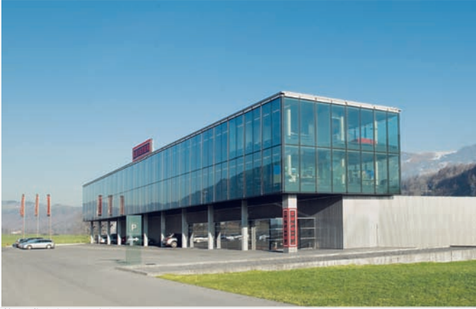
莱丹集团公司总部，瑞士