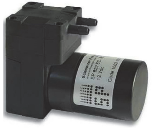
SP 622 EC-BL

舒茨作为 Schwarzer 在中国的紧密合作伙伴，我们在气体检测领域有多方位的合作，并在产品研发上共同探讨最佳解决方案。舒茨在为我们的客户提供气体检测系统产品的同时，也为客户提供完善的气体/液体预处理采样方案，选择最佳的采样泵，解决用户在实际应用当中的各类难题和期望。