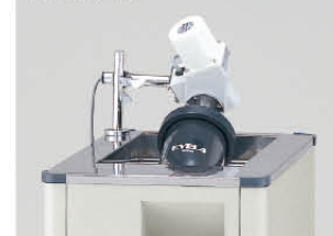
PFR-1000型 + PFM-1000型