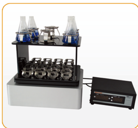
双层细胞培养摇床

我司摇床的标准尺寸可以完美配合市面上大多数250LCO 2 培养箱以及150L生化箱使用。用户也可以提供给我们具体培养箱尺寸以定制合适的培养摇床。