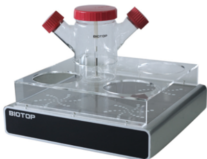
四瓶位磁力搅拌器