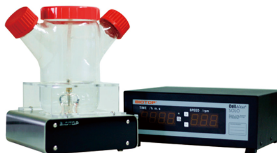
超低速细胞培养磁力搅拌器