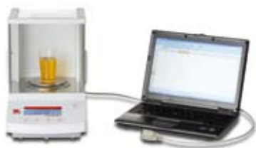
数据采集工具DDE 轻松获得称量信息