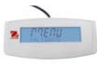
第二显示器(选配) 称量数据同步显示