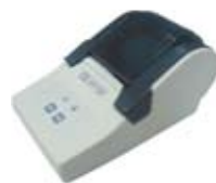
SF-F40S打印机(选配) GLP打印, 轻而易举