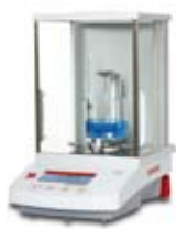
固体密度组件(选配) 适用于分析天平