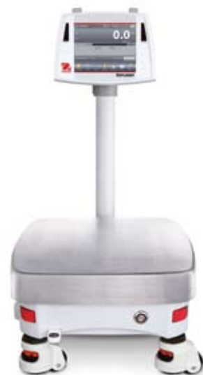
外接显示立柱和滚轮选件