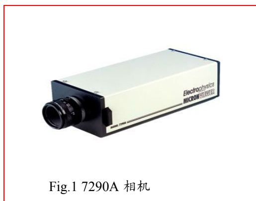
Fig.1 7290A 相机