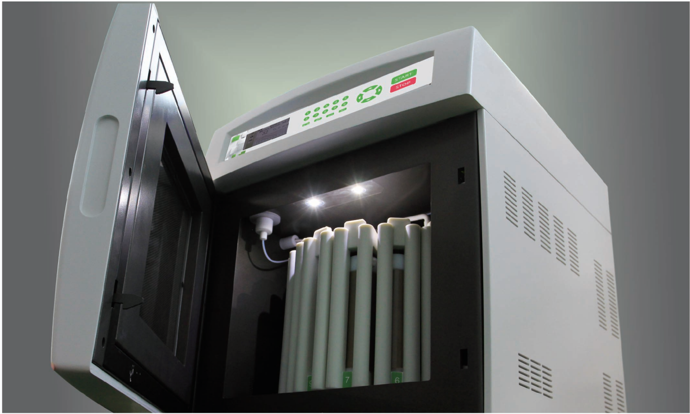
WX-8000 专家型密闭微波消解仪