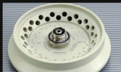
▶ 双排管 18 x 2.0/0.5 ml 转头, 带旋口盖