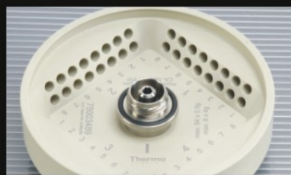
▶ 8 x 8 PCR 八联管转头, 带旋口盖