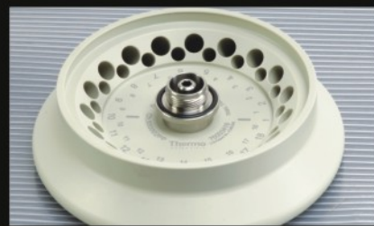
▶ 36 x 0.5 ml 转头, 带旋口盖