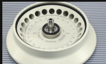
▶ 24 x 1.5/2.0 ml 转头, 带 ClickSeal 防生物污染转头盖