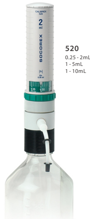
520 0.25 - 2mL 1 - 5mL 1 - 10mL