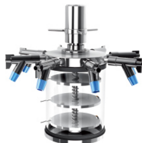
带压盖装置标准干燥腔配八口多歧管