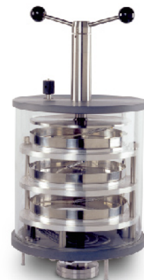
带压盖装置大尺寸干燥腔