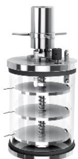
带压盖装置标准干燥腔