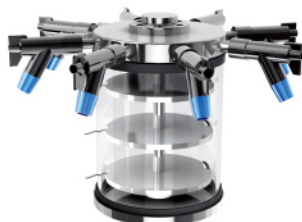
标准干燥腔配八口多歧管