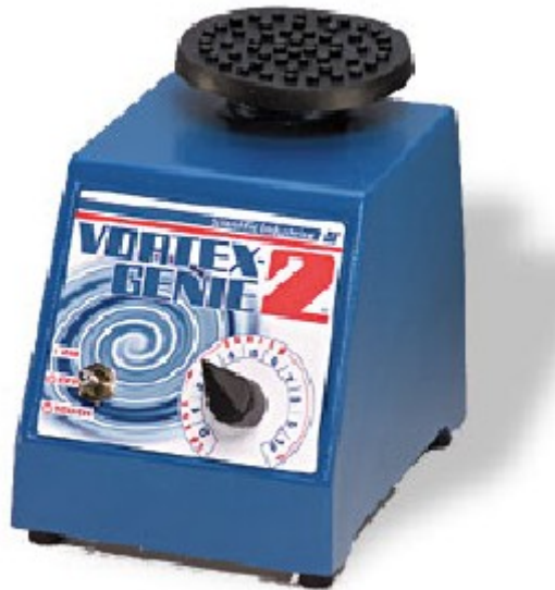
（图一）主机带 3"圆橡胶垫片

美国Scientific Industries公司出产的Vortex-Genie2 多功能旋涡混合器（又称“涡旋振荡器”），由于功能强大、坚固耐用和性能可靠等优点，已被作为一个国际标准实验室的仪器而得到广泛的使用。可选购多项组件做多种试管/容器振荡，用于不同的试管、烧杯、酶标板等容器的自动混均有旋涡混合及摇动混合功能，适合不同实验要求可根据不同的混合物体的性质，调整不同速度结果重复性好。