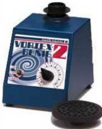
（图二）主机带单试管头垫片