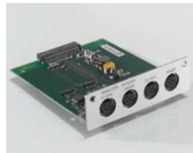
Barcode / SmartSample选项板