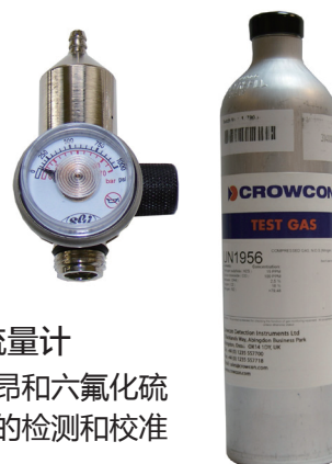
标准气和流量计 可提供氟利昂和六氟化硫 用于传感器的检测和校准