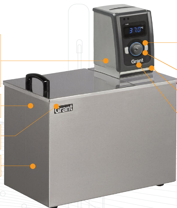
T100-MST20 Gerber bath