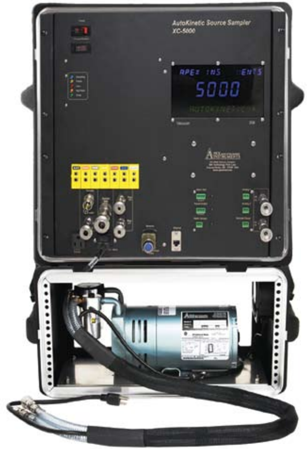
XE-0523 Pump Shown with Console

酸厂、沥青厂、锅炉、水泥厂、化工制造、电炉、焚化炉、市政废物燃烧炉、石油精炼厂、电厂、造纸厂、熔炼厂、钢厂