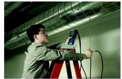
管道截面法测风量: 毕托管