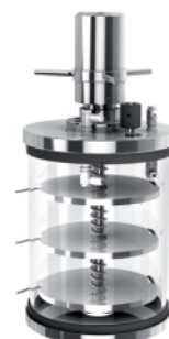
带压盖装置标准干燥腔