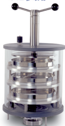
带压盖装置大尺寸干燥腔