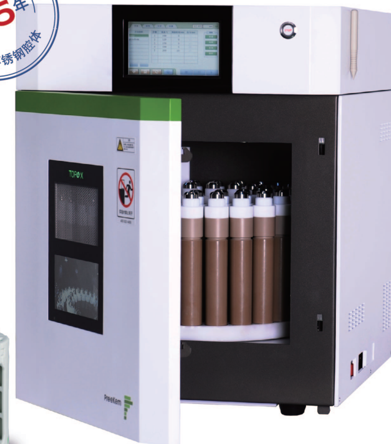
TOPEX 全能型微波化学工作平台