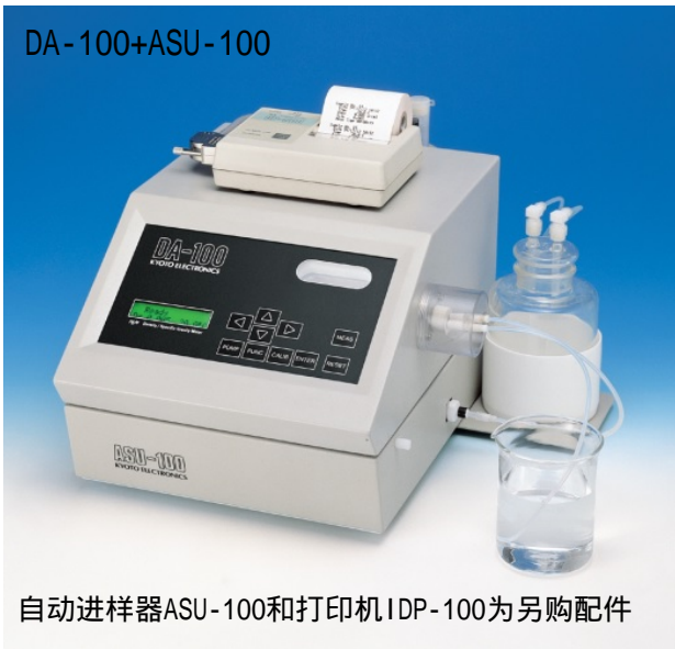
自动进样器ASU-100和打印机IDP-100为另购配件