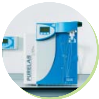
PURELAB Ultra Genetic 内部流程图