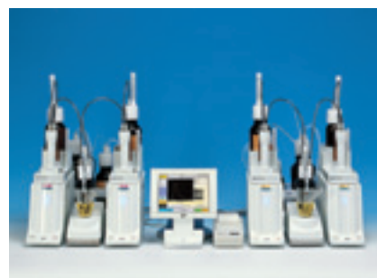
打印机IDP-100为另购配件