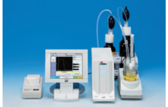
打印机IDP-100为另购配件