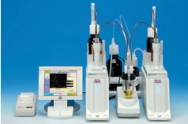
打印机IDP-100为另购配件