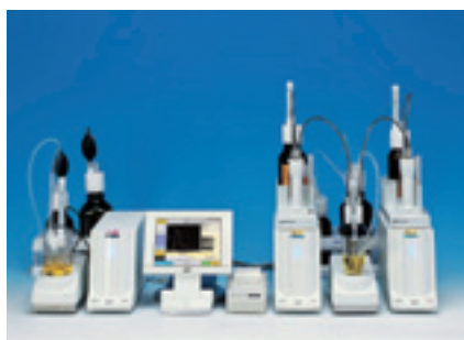
打印机IDP-100为另购配件