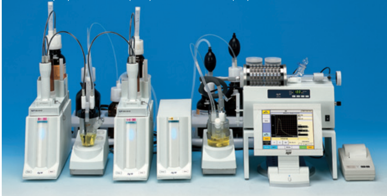
库仑电量法、容量滴定法、水分蒸发器

因应世界各地用户含水量测定的需求，是可靠性和精确度的解决方案。并符合各国标准，如：国际标准化组织(ISO)，美国材料与试验协会(ASTM)，欧洲药典(EN)，美国药典(USP)或中国国家标准(GB)等试验方法。