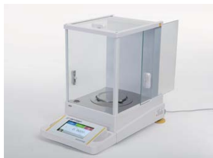
四级防震，称量速度可调。