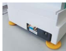
RS232接口 或USB接口双向通讯功能。

自动故障诊断，过载保护，超载报警功能。 工作环境温度测量显示，时间日期显示功能。 自动零位跟踪可调，显示精度可调功能。