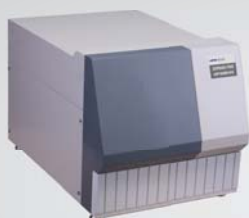
过程气体质谱分析仪