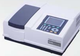
紫外可见分光光度计