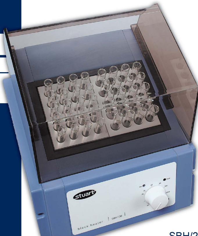
SBH/2 和 SBH130