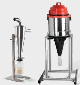
高性能旋风分离器和 FRITSCH 旋风分离器

结果： 以最小的热负荷达到高通量且快速有效的粉碎，同时无需清洗即可达到无交叉污染。