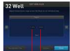
设置至多2个不同的32孔加热模块温度区域