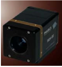
SID4 / SID4-HR