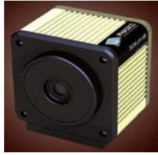
SID4 UV / SID4 UV-HR