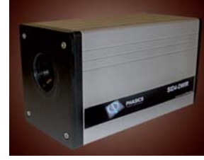
SID4-DWIR / SID4-SWIR