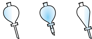
① 左起分别为球型、双重管型、梨型

分液漏斗振荡台的支架, 采用女性也可轻松固定容器的构造。另外, 针对球型、双重管型、梨型不同形状及尺寸, 备有丰富的配件供选择。