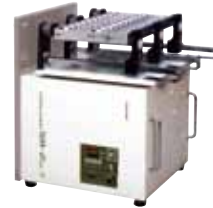
① SR-2DS主机也可以翻转90度使用